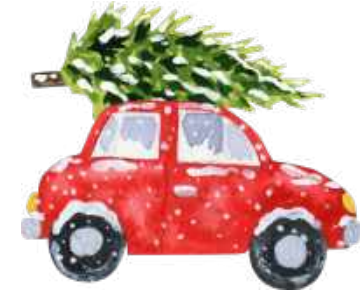
VOITURE DE NOËL