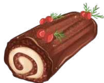
BUCHE DE NOËL