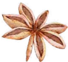
ÉTOILE DE BADIANE