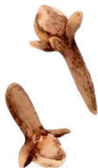
CLOUS DE GIROFLE